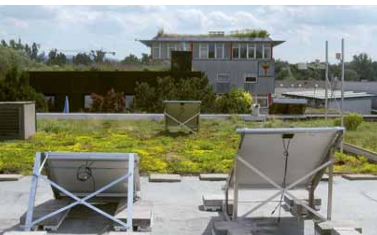
De hoofdrolspelers in het onderzoek: op de voorgrond de beide bitumen daken met zonnepanelen, daarachter het groendak met zonnepanelen. Rechts het weerstation.

Nu is dit laatste gegeven weliswaar in een beperkte maar groeiende kring al wat langer bekend, maar de roep om bewijs en kwantificering van de cijfers bleef lang onbeantwoord. Tot voor kort. ZinCo, leverancier van groendaksystemen, heeft op basis van uitgebreid onderzoek niet alleen bewezen dat de stelling klopt, maar ook dat de precieze winst uitstekend valt te becijferen.